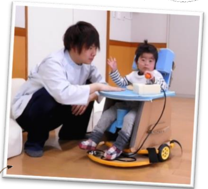
Baby Loco に座位保持装置を乗せて使っています。お子さまがレバーを操作することで動きます。

日時：平成 31 年 1 月 26 日 (土) 10:00~14:00 場所：「かるがも園」 兵庫県三田市井ノ草 808 番地 入場：無料 どなたでもお越しください。